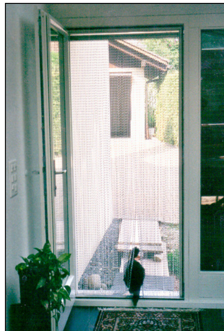
Vorhangansicht von innen

Montiert im Türrahmen zwischen Türe und Store