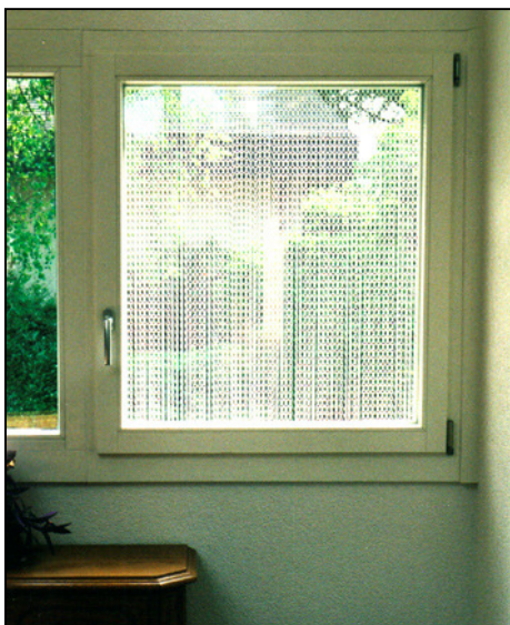
Vorhangansicht von innen an Fenster