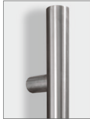
Edelstahl-Griffstange in verschiedenen Längen 400 mm bis 2000 mm erhältlich.