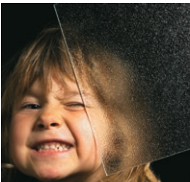
Ornament 504 weiß