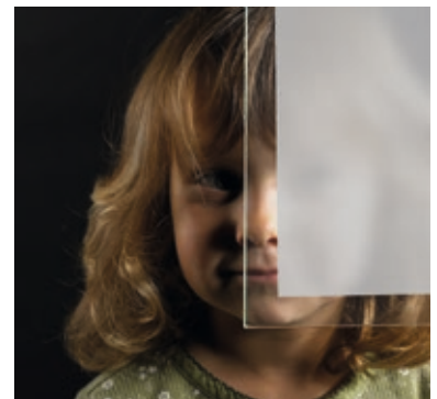
Mattiertes Glas mit klarem Rand