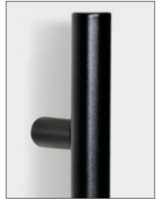
Schwarzstahl-Griffstange in den Längen 600 mm, 800 mm, 1200 mm, 1400 mm oder 1600 mm erhältlich.