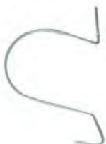
Feder Für Einfalhaken.