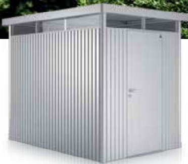
Größe: H2 Standardtüre kann anstelle eines Seitenwandelementes eingebaut werden.