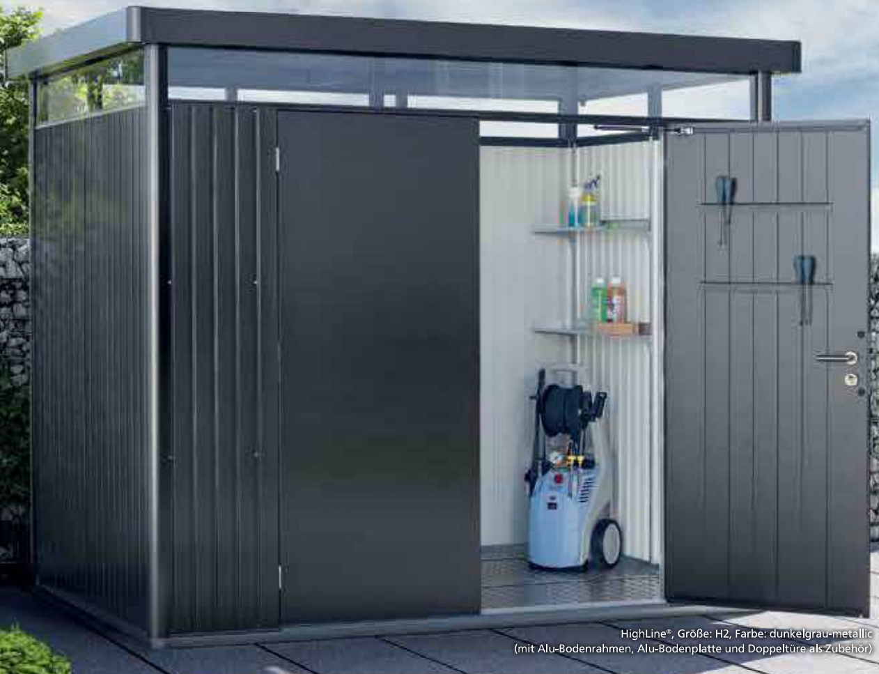
HighLine®, Größe: H2, Farbe: dunkelgrau-metallic (mit Alu-Bodenrahmen, Alu-Bodenplatte und Doppeltüre als Zubehör)