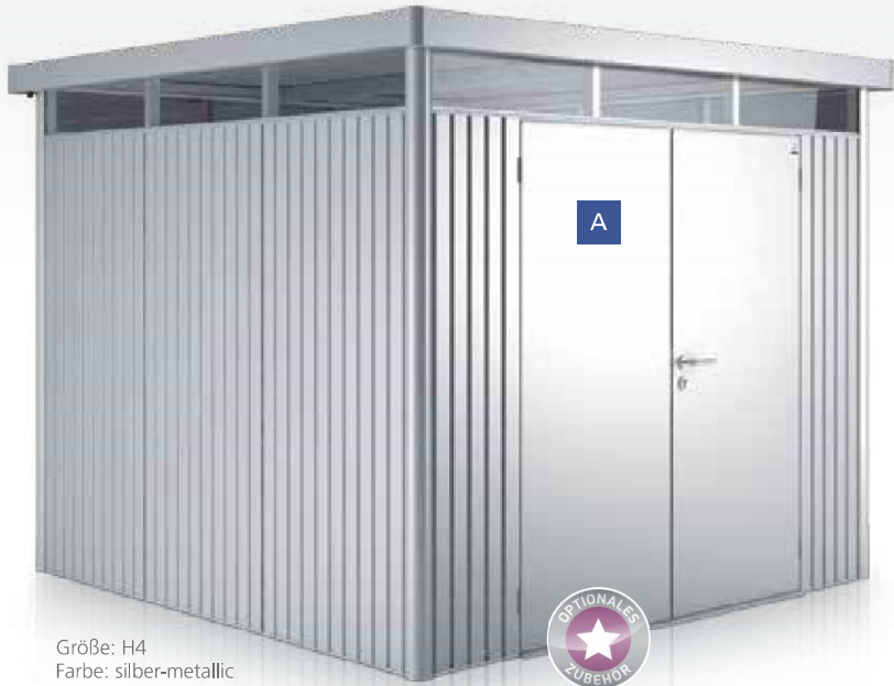
Größe: H4 Farbe: silber-metallic